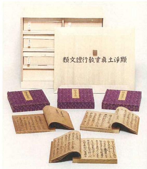
国宝『顯淨土真実教行証文類』（教行信証）坂東本 〈東本願寺蔵〉