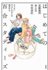
『はじめての百合スタディーズ クイア/フェミニストの視点から』 著者/近藤銀河 水上文 中村香住 発行/太田出版