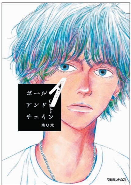
南Q太「ポールアンドチェイン」(マガジンハウス)1巻では主人公の「けいと」、2巻ではもう一人の主人公「あや」の若き日の姿が描かれている。